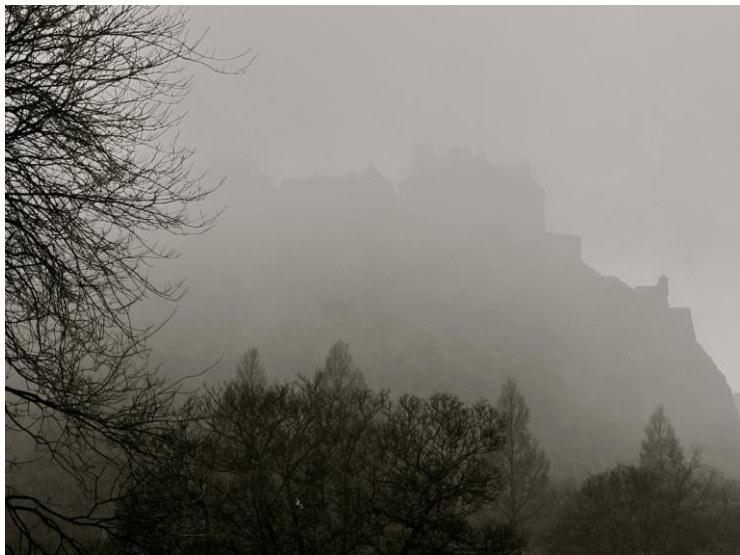
Titre de la photo : Kafka at home