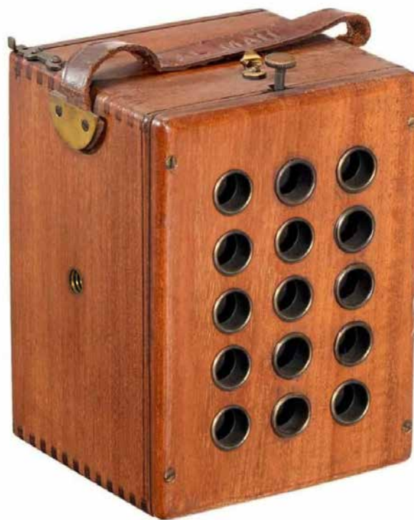
Appareil Royal Mail Stamp Camera de W. Butcher & Son, 1907 (collection particulière, droits réservés)

On connaissait depuis le milieu du XIXe siècle des appareils à objectifs multiples. En dehors des stéréoscopiques, et suivant les modèles, ils pouvaient, sur une seule plaque, prendre soit une seule photo en plusieurs exemplaires, soit des photos successives. On pouvait notamment prendre des portraits, imprimés ensuite sur des cartes de visites. Vraisemblablement à partir de 1860, on s'est intéressé à des photos au format « timbre-poste », qu'on pouvait transformer en médaillons, en boutons, ou simplement coller sur des courriers.